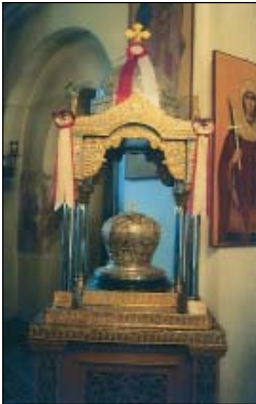
Τυμία Κέρα Ἁγίου Θεοδώρου