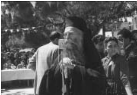
21 Μαΐου 1956. Ὁ Μητροπολίτης Μελέτιος ὁμιλῶν εἰς τὰ ἐγκαίνια τοῦ κτιρίου τοῦ Τριφυλλείου Νοσοκομείου Κυθήρων εἰς τόν Ποταμό.