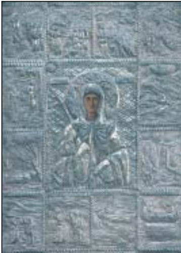
Ἄγια Ἑλέσα Κυθήρων