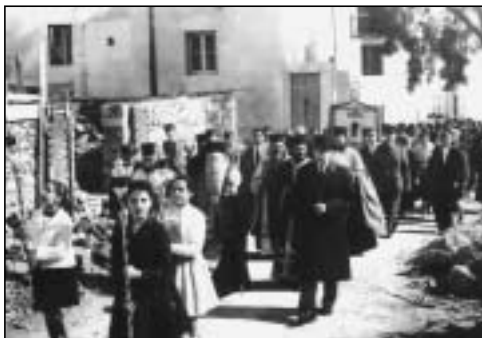
1960, Δευτέρα τῆς Διακαινησίμου. Ἀρχίζει ἡ δεύτερη μεγάλη λιτάνευση τῆς Μυρτιδιωτίσσης.