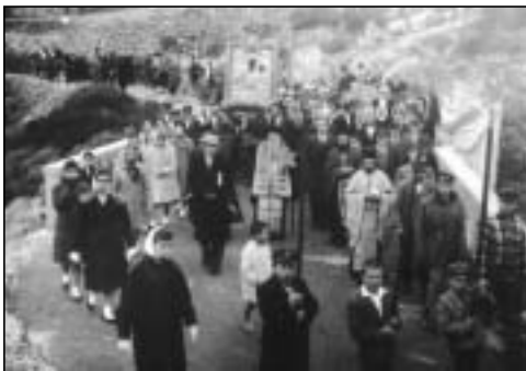
1961, Κυριακή τῆς Ὁρθοδοξίας. Λιτάνευση τῆς Μυρτιδιωτίσσης ἀπὸ τὰ Μυρτίδια στὴ χώρα.