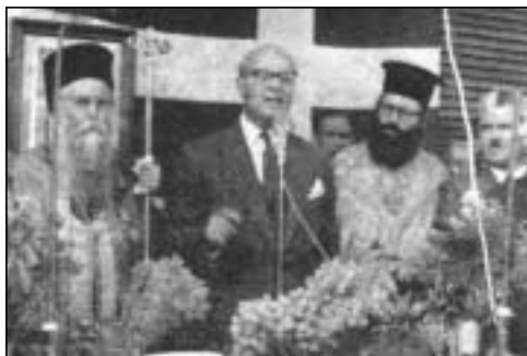
Ὁ Μητροπολίτης Μελέτιος εἰς τὰ ἐγκαίνια τοῦ Κρατικοῦ Νοσοκομείου Κυθήρων