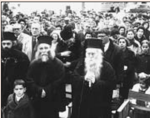
Ἑόρτιος ἐκδήλωσις εἰς τήν Οἰκοκυρικὴν Σχολὴν Μυλοποτάμου

Τό Ἱερόν Τέμενος Παναγίας Μυρτιδιωτίσσης ἐπλουτίσθη καί διά διαφόρων σκευῶν καί ἀμφιέσεως.