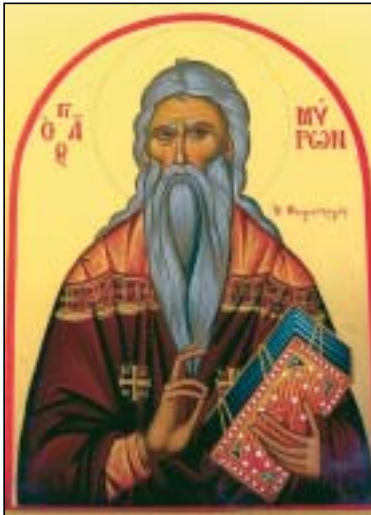
Ὁ Ἅγιος Μύρων