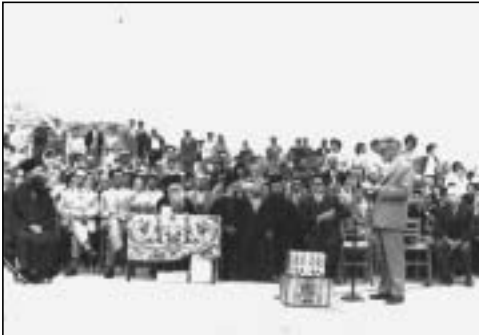
1962. Γυμναστικές ἐπιδείξεις τοῦ Γυμνασίου Κυθήρων.