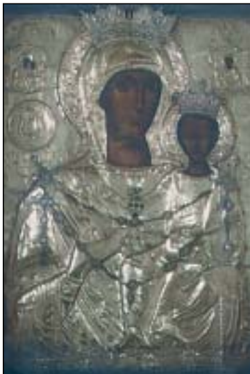
Ἄγια Μόνη (Παναγία)