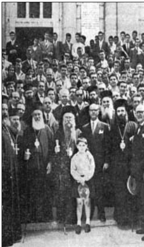
Μετά τήν χειροτονίαν τοῦ Μακαριστοῦ Μελετίου