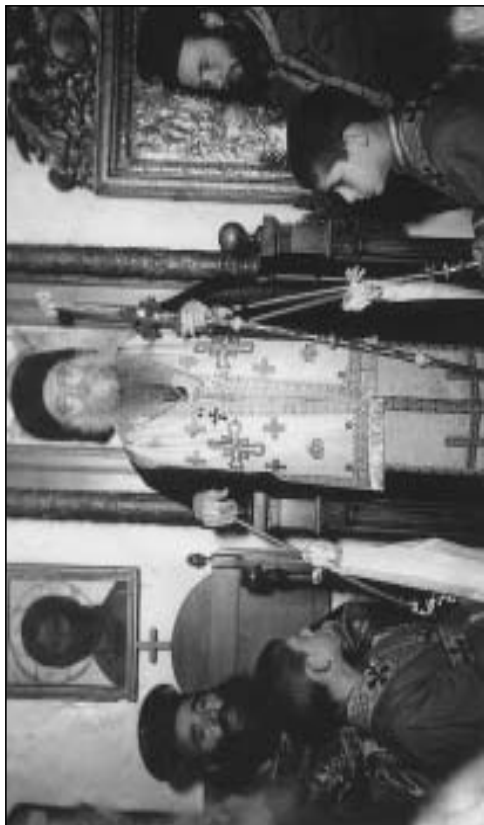
Μεγάλη Πέμπτη 1956. Ο Μητροπολίτης Μελέτιος στον Αρχιερατικό Θρόνο του Μητροπολιτικού Ναού του Εσταυρωμένου στην Χώρα κατά την τελετή της ένθρονισιάς του.