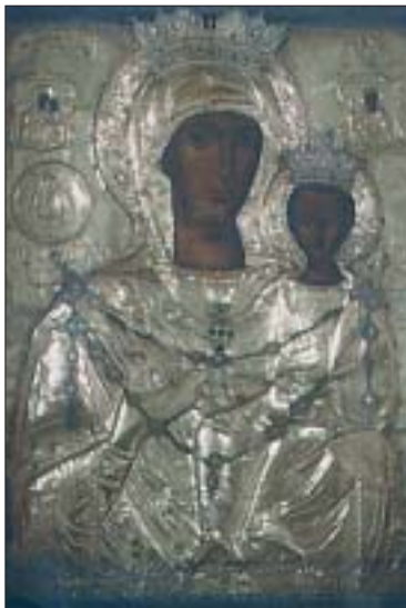
ΑΓΙΑ ΜΟΝΗ (ΠΑΝΑΓΙΑ)