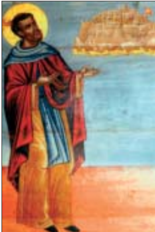
Ὁ Ἅγιος Θεόδωρος ὁ ἐν Κυθήροις