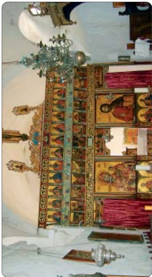
Τό Ἱερό Τέμπλο τῆς Μυρτιδιώτισσας τοῦ Κάστρου