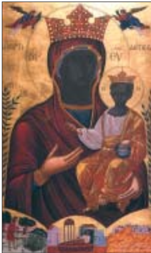
Παναγία ἡ Μυρτιδιώτισσα τοῦ Ἱ. Ναοῦ τοῦ Ἄλιμου