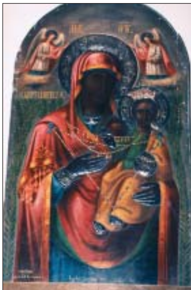
Παναγία ἡ Μυρτιδιώτισσα τοῦ Ἱ. Ναοῦ τοῦ Ν. Φαλήρου