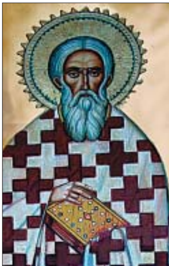
Ὁ Ἅγιος Μύρων, Πολιοῦχος Ἀντικυθήρων