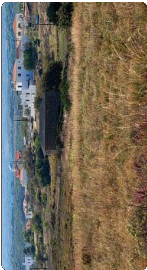
Γενική άποψις τών Μητάτων