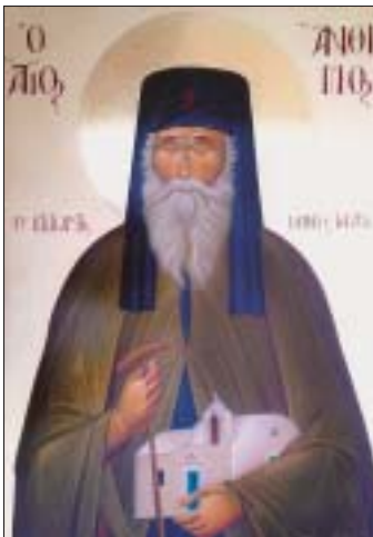
Ὁ Ἅγιος Ἄνθιμος ὁ νέος ὁ ἐκ Κεφαλληνίας