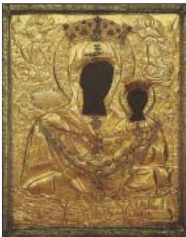
Η ΠΑΝΑΓΙΑ ΜΥΡΤΙΔΙΩΤΙΣΣΑ ΠΟΛΙΟΥΧΟΣ ΚΥΘΗΡΩΝ