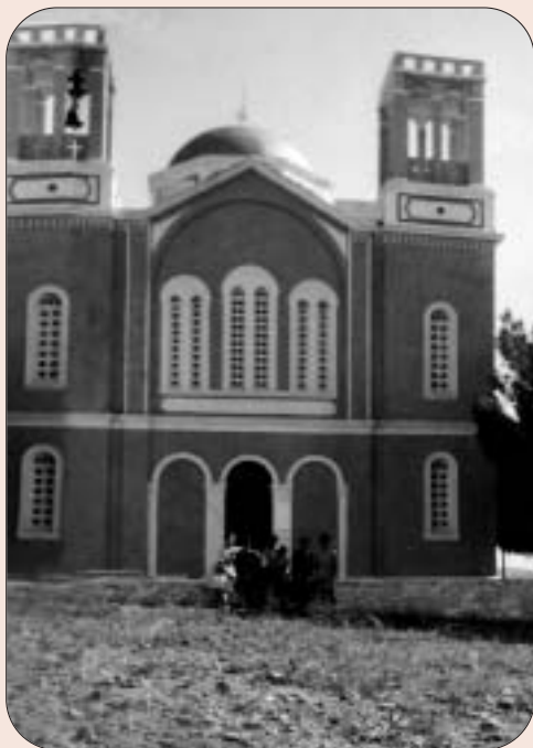
Ἡ κεντρική εἴσοδος τοῦ ἐνοριακοῦ Ναοῦ