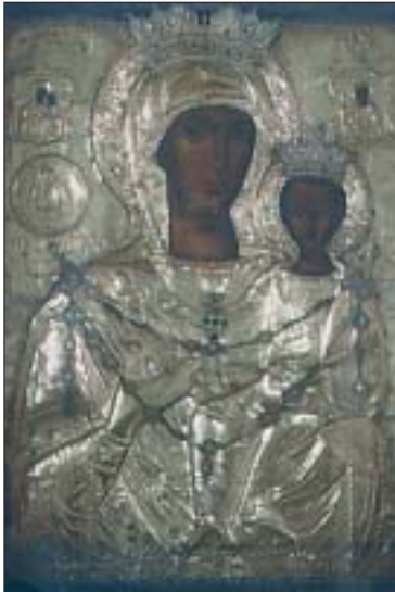
ΑΓΙΑ ΜΟΝΗ (ΠΑΝΑΓΙΑ)