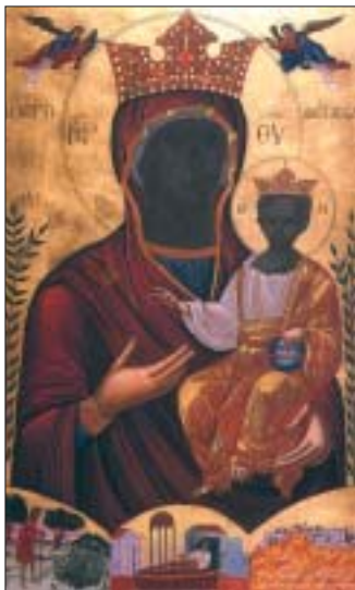
Παναγία ἡ Μυρτιδιώτισσα (τοῦ Ἱ. Ναοῦ) τοῦ Ἁλίμου