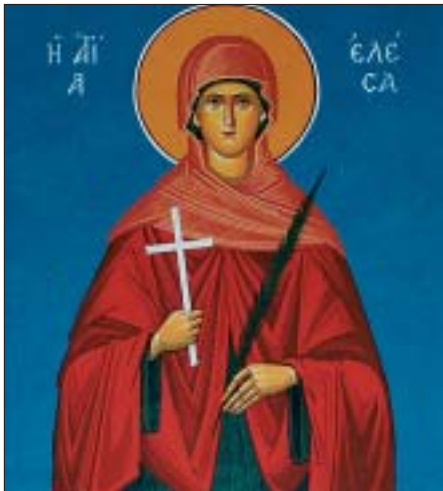
Ἡ Ἁγία Ὁσιοπαρθενομάρτυς Ἐλέσα ἡ ἐν Κυθήροις