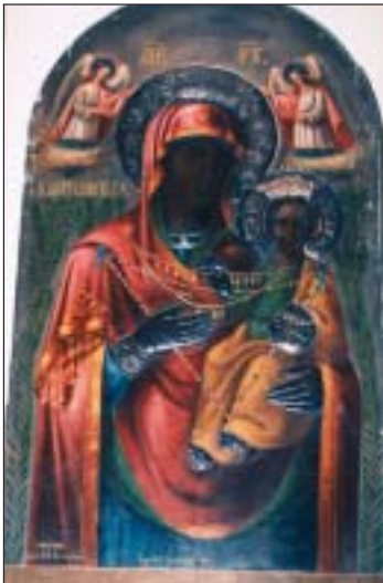
Παναγία ἡ Μυρτιδιώτισσα (τοῦ Ἱ. Ναοῦ) τοῦ Ν. Φαλήρου