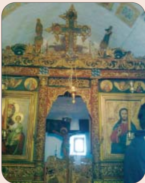
Τό παλιό τέμπλο τῆς Ἰλαριώτισσας στά Τριφυλλιάνικα.