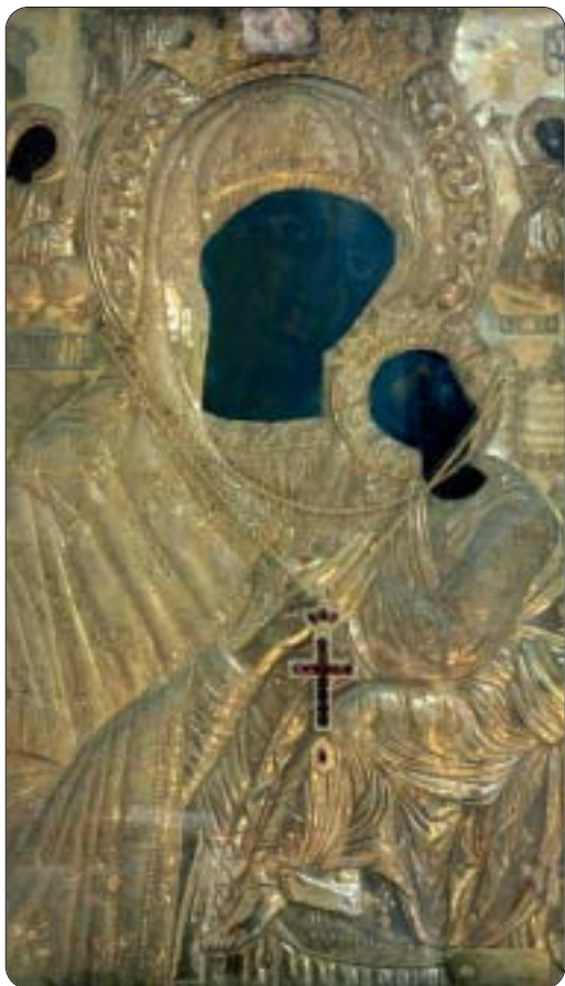
Παναγία Ἰλαριώτισσα Κυθήρων.