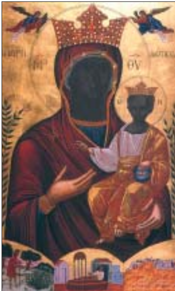
Παναγία ἡ Μυρτιδιώτισσα (τοῦ Ἱ. Ναοῦ) τοῦ Ἀλίμου