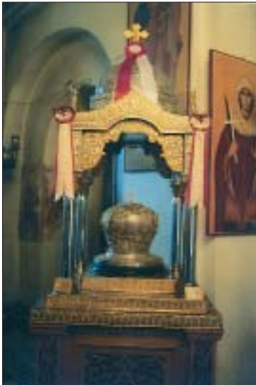
Ἡ Τιμία Κάρα τοῦ Ὁσίου Θεοδώρου τοῦ ἐν Κυθήροις.