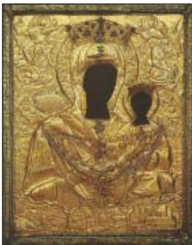
Η ΠΑΝΑΓΙΑ ΜΥΡΤΙΔΙΩΤΙΣΣΑ ΠΟΛΙΟΥΧΟΣ ΚΥΘΗΡΩΝ