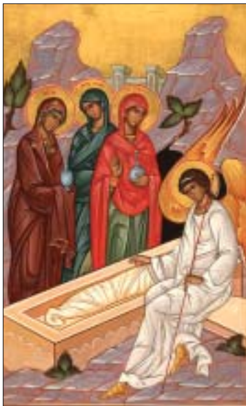
Ἡ Ἀνάστασις τοῦ Χριστοῦ.