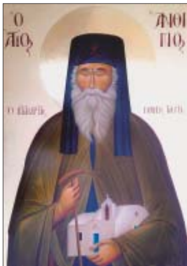
Ὁ Ἅγιος Ἄνθιμος ὁ νέος ὁ ἐν Κεφαλληνία