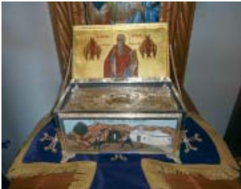
Ἱερόν Λείψανον Ἀγ. Μύρωνος Ἀντικυθήρων.

Τιμία Κάρα τοῦ Ὁσίου Θεοδώρου τοῦ ἐν Κυθήροις. Ἱερά Λειψανοθήκη εἰς Ἱεράν Μονήν Μυρτιδίων. Ἱερόν Λείψανον Ἀγίου Ἱερομάρτυρος Ἐλευθερίου. Ἱερά Λείψανα Ἀγίας Ὁσιοπαρθενομάρτυρος Ἀναστασίας τῆς Ῥωμαίας καί Ἀγίας Ἀναστασίας Φαρμακολυτρίας. Ἱερόν Λείψανον Ἀγίου Ἱερομάρτυρος Χαραλάμπους τοῦ Θαυματουργοῦ. Ἱερόν Λείψανον Ἀγίου Ἱερομάρτυρος Μύρωνος, Πολιοῦχου τῶν Ἀντικυθήρων. Ἱερά Λείψανα Ἀγίων Μαρτύρων Εὐστρατίου, Αὐξεντίου, Εὐγενίου καί Μαρδαρίου.