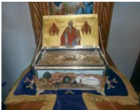
Ἱερόν Λείψανον Ἀγ. Μύρωνος Ἀντικυθήρων.

Τιμία Κάρα τοῦ Ὁσίου Θεοδώρου τοῦ ἐν Κυθήροις. Ἱεραὶ Λειψανοθήκαι εἰς Ἱεράν Μονήν Μυρτιδίων. Ἱερόν Λείψανον Ἀγίου Ἱερομάρτυρος Ἐλευθερίου. Ἱερά Λείψανα Ἀγίας Ὁσιοπαρθενομάρτυρος Ἀναστασίας τῆς Ρωμαίας καί Ἀγίας Ἀναστασίας Φαρμακολυτρίας. Ἱερόν Λείψανον Ἀγίου Ἱερομάρτυρος Χαλαάμπους τοῦ Θαυματουργοῦ. Ἱερόν Λείψανον Ἀγίου Ἱερομάρτυρος Μύρωνος, Πολιούχου τῶν Ἀντικυθήρων καί ἕτερα Ἱερά Λειψανοθήκη. Ἱερά Λείψανα Ἀγίων Μαρτύρων Εὐστρατίου, Αὐξεντίου, Εὐγενίου καί Μαρδαρίου.