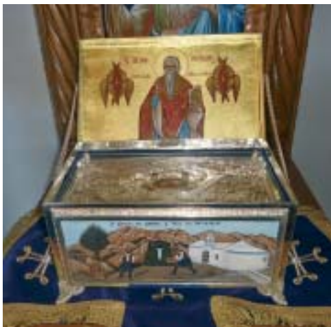
Ἱερὸν Λείψανον Ἁγ. Μύρωνος Ἀντικυθήρων.