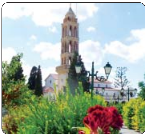
Τό νέο Καθολικό τῆς Μονῆς τῶν Μυρτιδίων.