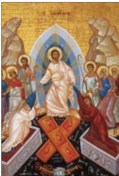
Ἡ Ἀνάστασις τοῦ Χριστοῦ.