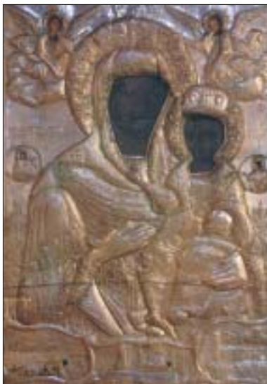
Παναγία ἡ Μυρτιδιώτισσα Ἱ. Μητροπολιτικοῦ Ναοῦ Ἀθηνῶν