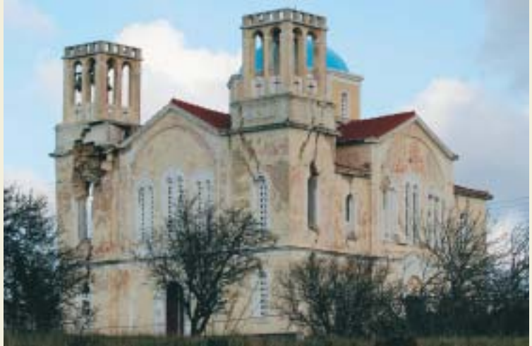
Ὁ σοβαρῶς ὑπό τοῦ σεισμοῦ πληγείς Ἱ. Ν. Ἀγίας Τριάδος Μητάων.

Στό προσεχές φύλλο θά γίνη ἐκτενής ἀναφορά στά γενόμενα καί τήν ἀντιμετώπισιν τῆς ὅλης καταστάσεως.