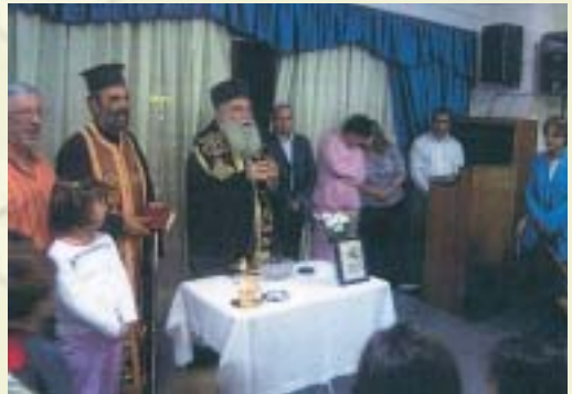
Κυθηραϊκὴ Ἀδελφότητα Πειραιῶς. (7-10-2005)