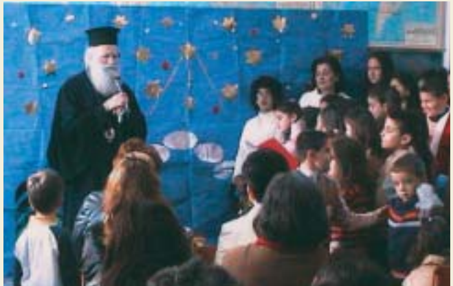
Ἀπό τήν χριστουγεννιάτικη γιορτή τοῦ Δημοτικοῦ Σχολείου Χώρας Κυθήρων.

Τήν 23ῆ Δεκεμβρίου, τελευταία ἡμέρα πρό τῶν ἐορτῶν ὁ Σεβασμιώτατος ἐπεσκέφθη τό Γυμνάσιο - Λύκειο Κυθή-