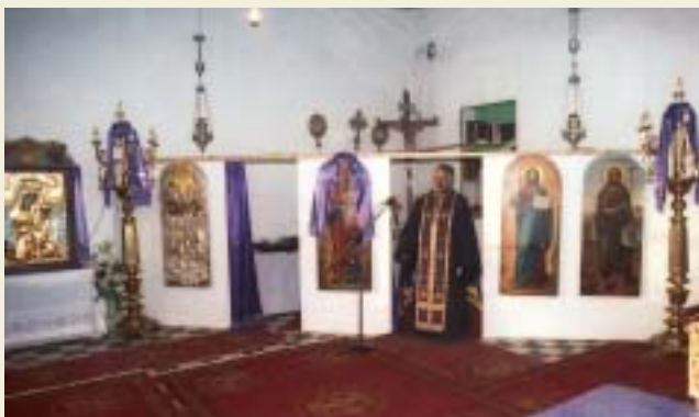
Ὁ προσωρινὸς Ἱ. Ναὸς τῶν Μητάτων στὸ Σχολεῖο.

καθὼς καὶ στὸ καμπαναριὸ τοῦ Ἐσταυρωμένου στὰ Πιτσιλιάνικα καὶ τοῦ Ἁγίου Σπυριδῶνα στὶς Καλοκαιρινές, ποῦ κρίθηκε ἀκατάλληλο καὶ λίαν ἐπικίνδυνο. Στὴν Παναγία τῆς Μυρτιδιώτισσας ἀποκολλήθηκε κομμάτι τοῦ μαρμάρου τῆς τέμπλου