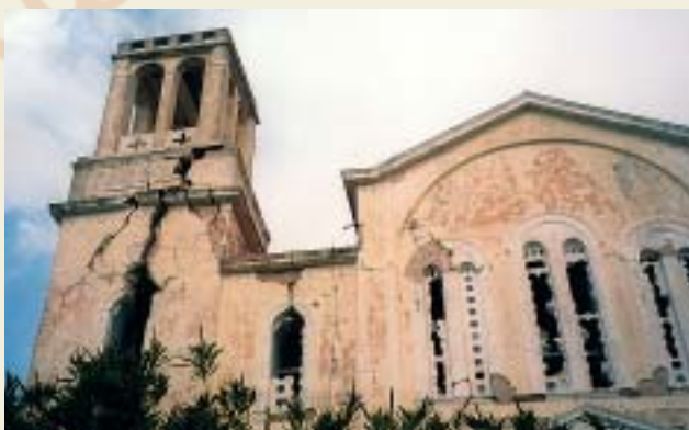
Μερικὴ ἀποψη τοῦ Ἱ. Ναοῦ Ἁγ. Τριάδος Μητάτων

Μεγάλες ζημιές εἶχαμε καὶ στὸν ἱστορικὸ βυζαντινὸ ναὸ τοῦ 10ου