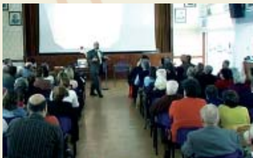
Άπό τήν εισήγηση του Καθηγητού κ. Ηλία Ματσαγγούρα

κνωση τό ελληνικό στοιχείο μέσα στην ίδια του την χώρα, ώστε νά διαγράφεται στό μέλλον ή απειλή νά άποτελέσουν οι έν Έλλάδι Έλληνες άπλώς την