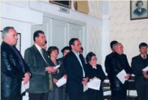
Τά μέλη τῆς Χορωδίας πού ἔψαλαν πρό τῆς διαλέξεως.

σχολεῖων μας ὄλων των βαθμίδων, ὁ κ. Δήμαρχος καὶ ἄλλοι ἐκπρόσωποι τῶν ἀρχῶν τοῦ νησιοῦ μας.