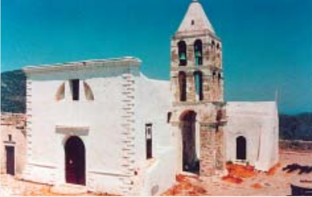
Ναός Παναγίας Μυρτιδιώτισσας στό Κάστρο Χώρας Κυθήρων

του Πάσχα άρχιζε ή «γύρα» στα χωριά μας για 10 ήμερες. Κατόπιν επέστρεφε πάλι στο Κάστρο. Κατά τό 15αύγουστο καί τά Χριστούγεννα εξετίθετο σέ λαϊκό προσκύνημα στό ναό του Κάστρου. Στίς