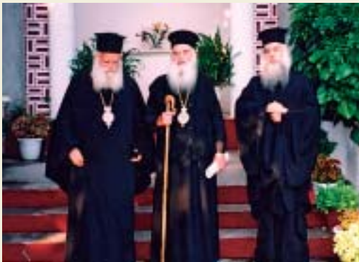
Ὁ μακαριστὸς Σεβ. Κωνσταντῖνος μετὰ τὸν Σεβ. Μητροπολίτη μας κ. Σεραφεῖμ λίγες μέρες μετὰ τὴ χειροτονία τοῦ δευτέρου καὶ τὸν Πρωτ. π. Ἰωαννίκιο Κалаφάτη.

Ἡ νεκρώσιμος Ἀκολουθία τοῦ ἀλήστου μνήμης σεπτοῦ Γέροντος Ἀρχιερέως ἐψάλη εἰς τὸ Μητροπολιτικὸν Ναὸν Λεβαδείας τὸ ἀπόγευμα τῆς ἐορτῆς τοῦ Εὐαγγελισμοῦ τῆς Θεοτόκου, προεξάρχοντος τοῦ Σεβ. Μητροπολίτου Θηβῶν καὶ Λεβαδείας κ. Ἰερωνύμου, πλαισιουμένου ὑπὸ ἕξ (6) Ἀρχιερέων. Κα-