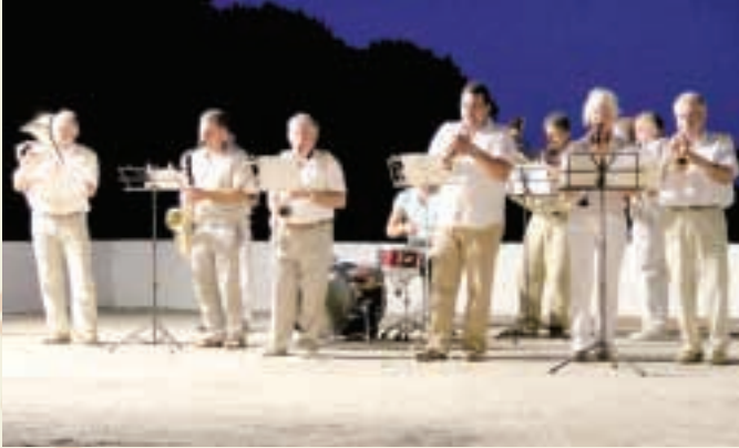
Τμήμα της Φιλαρμονικής των Κυθήρων.

Μετέφεραν στή νέα γραφή όλα τὰ ἀρχαία κείμενα, ὁ Χρῦσανθος ἔγραψε τὸ Μέγα Θεωρητικὸν τῆς Ἐκκλησιαστικῆς Μουσικῆς καὶ δίδαξαν στήν Πατριαρχική Μουσική Σχολή ἀπ' ὅπου ἀποφοίτησαν πάρα πολλοὶ σπουδαστές. Ἡ προσπάθεια τῶν τριῶν διδασκάλων ὀλοκληρώθηκε μέ τήν ἐπιτροπή τοῦ 1881 πού καθόρισε τὰ διαστήματα τῆς Βυζαντινῆς Μουσικῆς καὶ συνέταξε θεωρητικό γιά τήν διδασκαλία τῆς Βυζαντινῆς Μουσικῆς, σάν συμπλήρωμα τῶν θεωρητικῶν τοῦ Χρῦσανθου.