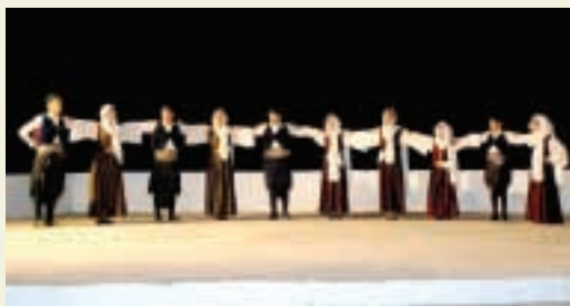
Τά παιδιά του χορευτικού μας συγκροτήματος.

...Η έννοια τής αξίας τελικώς εκφράζεται ως τό μέτρον του όντος καί όλων τών ανθρωπίνων δραστηριοτήτων. Κάθε απόπειρα έκτροπής τής από τήν αποστολή τής αυτή όδηγεϊ σέ πλήρη αποδυνάμωση τής ουσίας τής, αλλά καί περαιτέρω στήν άκύρωση τής ύπάρξεώς τής, καθ' όσον ή αξία δέν ύπάρχει καθ' έαυτήν, παρά μόνον ως αξία τινός. Έπομένως, ή αξία ως προσδιοριστική ιδιότητα τών όντων καί τών πραγμάτων γενικώτερον διακρίνεται ως αξία προσωπική, αξία ήδονών καί