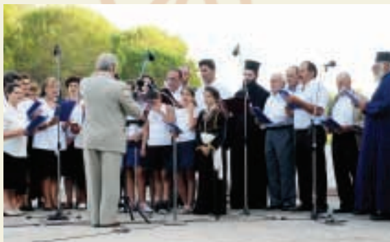
Η εκκλησιαστική χορωδία.

άνθρωπιστικού ιδεώδους, άποτελεί τήν μεγάλη ανάγκη τών νέων ανθρώπων, εκείνων πού μέ άγωνία αναμένουν από τήν σημερινή πολιτική και πνευματική ήγεσία ν' ανταποκριθούν στό αίτημά τους. Ένα είναι τό χρέος τής ήγεσίας. Χρέος πρός τήν νεότητα, στήν όποία όφείλει νά έναπο-