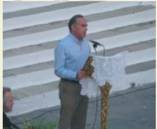
Ὁ Ὑπουργὸς κ. Ἀρβανιτοπούλος.

Εὐχάριστη ἔκπληξη τῆς βραδιάς ἡ ἀφιξη στὸν χῶρο τῆς ἐκδηλώσεως τοῦ Ὑπουργοῦ Παιδείας καί Θρησκευμάτων κ. Κωνσταντίνου Ἀρβανιτοπούλου, ὁ ὁποῖος ἔλαβε τὸν λόγο.